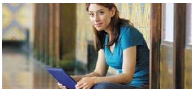
Las españolas ligan más por Internet que las británicas y francesas EUROPA PRESS

Un estudio realizado por la compañía Mobifriends, un servicio para conocer gente nueva a través de la Red, establece que actualmente "la mujer española ha evolucionado tanto que también lo ha hecho en la manera de relacionarse y buscar pareja".